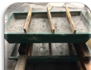
二段に重ねられる