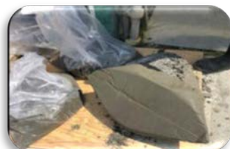
きれいにはがれた