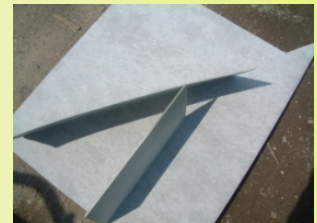
フレキシブルボード