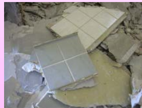
タイル付きボード