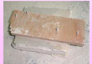
木くず付きボード